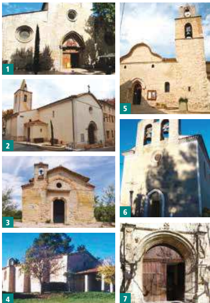
1. Église Saint-Sauveur de Manosque. 2. Église Saint-Sébastien de Corbières. 3. Chapelle Saint-Patrice de Pierrevert. 4. Chapelle Toutes-Aures de Manosque. 5. Église Saint-Pierre de Pierrevert. 6. Église Notre-Dame-de-Beauvoir de Sainte-Tulle. 7. Église Notre-Dame-de-Romigier de Manosque.