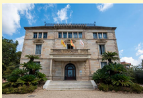
Auberge de jeunesse à Barcelone