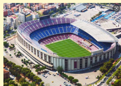
Stade en option