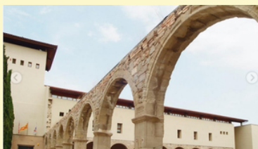
Auberge de jeunesse à Manrese